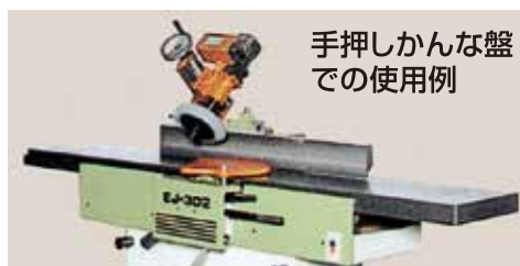
手押し可能な盤での使用例